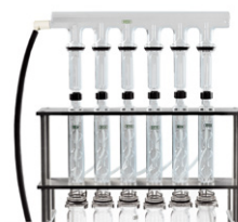
Reflux Setup С водяным или воздушным обратным холодильником