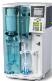
KjelFlex K-360 Паровая дистилляция