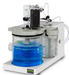
Scrubber K-415 Нейтрализация