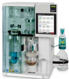
KjelMaster K-375 Паровая дистилляция и титрование