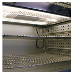
Освещение с 3 люминесцентными лампами светло-белого света и 2 лампы BINDER Synergie Light на каждую кассету