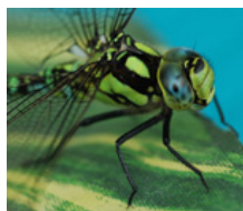
Растениеводство и разведение насекомых