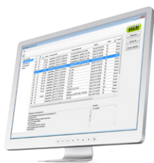
NIRAnywhere Software Сетевое решение