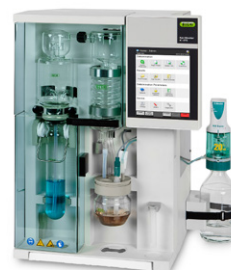
KjelMaster K-375 Паровая дистилляция и титрование