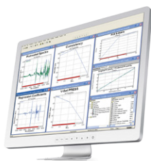
NIRCal® Software Разработка хемометрической калибровки