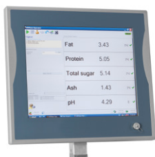
Monitor IP65 Влагозащищенный сенсорный экран